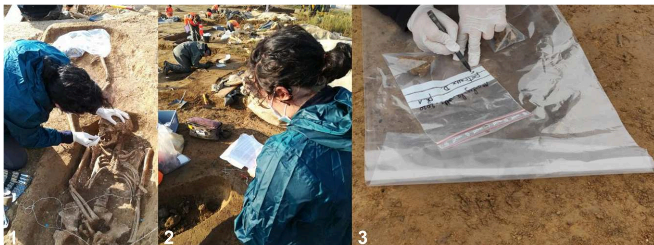
Figure 3. Exemples de prélèvements d'échantillons réalisés sur le terrain, fiche d'enregistrement et conditionnement (Crédits photos 1 et 2 – Sophie Lafosse. Photographies prises avec l'autorisation de la responsable d'opération Aurélie Mayer ; Crédits photo 3 - Jean-Gabriel Pariat. Photographies diffusées avec l'autorisation de la responsable d'opération Aurélie Alligri) / Examples of archaeological sampling in the field, sampling sheet and packaging (Photo credits 1 and 2 - Sophie Lafosse. Photographs taken with the authorization of the operation manager Aurélie Mayer; Photo credits 3 - Jean-Gabriel Pariat. Photographs released with the permission of the operation manager Aurélie Alligri)

extraction ADN, exploitation de l'ADN et des résultats) du projet (figure 1) 3 . Si un projet d'analyse souhaite inclure des échantillons de beDNA alors que l'opération dont ils sont issus est toujours en cours, l'accord du responsable d'opération est un préalable à tout examen par les services de l'État.